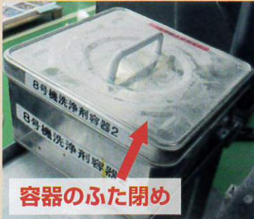
(一社) 日本印刷産業連合会より提供